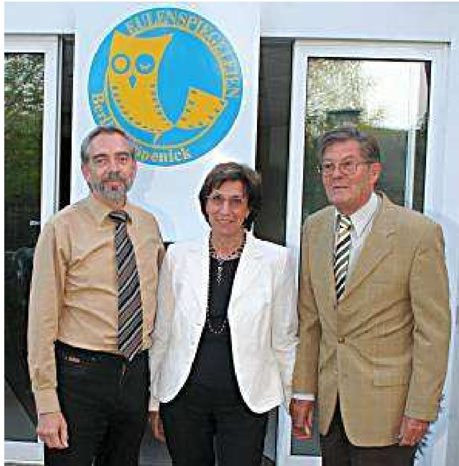
EULENSPIEGELEIENLEUTE - 34. EULENSPIEGELEIEN (DEU) - UNICA PATRONAGE

ORGANE OFFICIEL DE L'UNION INTERNATIONALE DU CINEMA, MEMBRE DU CONSEIL INTERNATIONAL DU CINÉMA ET DE LA TÉLÉVISION À L'UNESCO