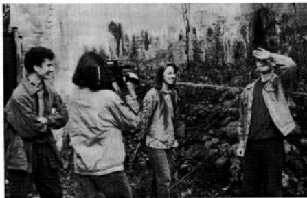
Young film-makers, aged 16, taking a video in Porež, last October. Jeunes créateurs du film, 16 ans, filment un vidéo dans Porež, le dernière Octobre. Junge Filmautoren, 16 Jahre alt, drehten im Vergangenheiten Oktober ein Video in Porež.

Super8-Filme sind ungewöhnlich und die Preise sind doppelt so hoch wie in Deutschland. Die Situation von 16 mm ist besser, weil man kostenlos 10 kilometer