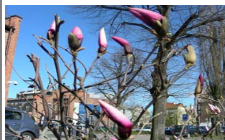
Frühling in Gdansk