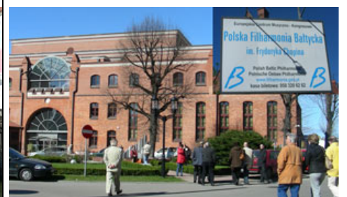
The Filharmonia Building for the UNICA 2009 Congress in Gdansk