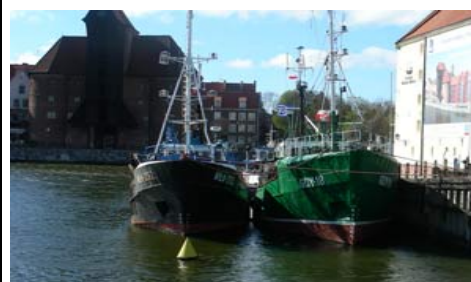
Au Coeur de Gdansk